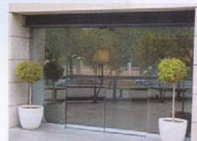
PUERTAS AUTOMÁTICAS DE VIDRIO