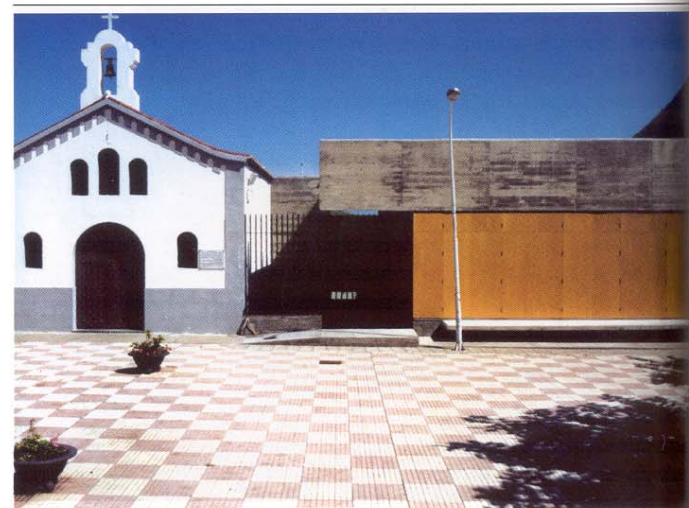
(8-2.1) Centro cultural San Bernardo, de J.A. González Pérez, Urbano Yanes y Félix Perera (Finalista Premios FAD de Arquitectura 2003)

Impulsados por ARQ-INFAD, la Asociación Interdisciplinaria de Diseño del Espacio del FAD, esta prestigiosa convocatoria reúne desde 1958 lo más destacado