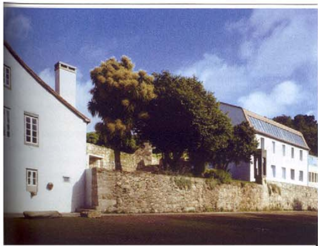
Fig. 23 Viviendas en La Vaquería del Carme de Abaixo, de V. López Cotelo y J.M. Vargas Finalista Premios FAD de Arquitectura 2003

Una exposición previa de planos y fotografías de las obras finalistas pasará por Olot, antes de regresar al FAD, donde se mostrará, de manera más completa, durante la fiesta de entrega de los Premios a finales de junio.